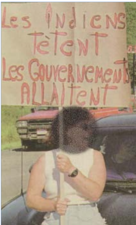
En situation de crise, la frontière entre la manifestation des idées et l'intolérance est facile à franchir. Au cours d'une contre-manifestation, en août 1998, des citoyens des environs de Pointe-à-la-Croix ont bloqué l'accès au Nouveau-Brunswick pour protester contre les barricades dressées quelque temps plus tôt par des Micmacs de Listuguj. Cette photo, qui a fait la une des grands quotidiens, en dit long sur l'état d'esprit des manifestants. L'affiche, on le voit, véhicule un préjugé fort répandu voulant que les autochtones, sans distinction, soient des éternels « exploités du système ».

l'opinion des francophones et des anglophones du Québec pour le compte de La Presse et de Radio-Québec , révélait que 52 % des francophones interrogés se disaient d'avis que la qualité de vie dans les réserves est « bien meilleure » ou « un peu meilleure » que celle des Québécois vivant dans le reste du Québec. Plus étonnant encore, seulement 9 % des francophones répondants étaient d'avis que les conditions de vie étaient beaucoup moins bonnes dans les réserves. Les résultats indiquaient par ailleurs des résultats différents chez les anglophones.