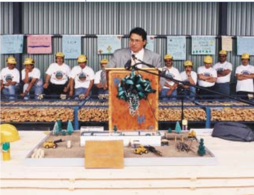
Un groupe de travailleurs cris assiste à l'ouverture de la scierie de Waswanipi, une entreprise résultant du partenariat entre une corporation crie et une papetière. Les activités ont débuté en 1997.

En 1992, on s'inquiète à Chibougamau des répercussions économiques de la fermeture de la mine Westminer. Depuis le début des années 80, la population de la ville est en déclin constant. De 12 000 habitants elle est