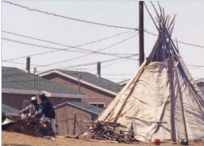
Architecture traditionnelle et architecture moderne se côtoient dans les communautés crie.

Ces quelques exemples démontrent bien les liens inévitables d'interdépendance entre les communautés autochtones et les communautés environnantes.