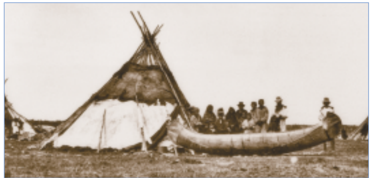
Groupe d'Amérindiens à Fort Georges, 1896. À remarquer la forme très recourbée du canot d'écorce, de fabrication crie.

Du point de vue des droits de la personne et à l'heure de la promotion du droit à l'égalité, pareilles mesures apparaissent relever d'un autre siècle. Pourtant, tel que mentionné, ce n'est qu'en 1985 que cette disposition arriérée sur l'émancipation a été abolie. Incroyable, n'est-ce pas? En fait, les seuls choix réservés aux Indiens