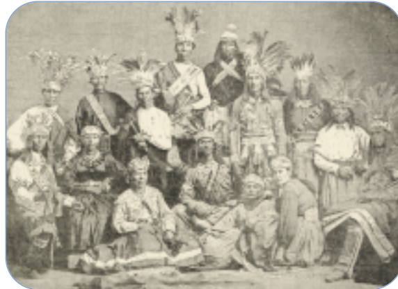
Groupe d'Amérindiens à un tournoi de lacrosse, 1869. Gravure d'après une photo de Inglis.

Cependant, on doit dire de la Loi sur les Indiens qu'elle est en réalité une déformation de cette responsabilité de protection. Car, si au départ ils étaient des « nations et tribus » dont il fallait assurer la « protection », ils deviendront dans les faits des citoyens mineurs sous la tutelle du gouvernement fédéral . Au nom de la protection, on se permettra de décider ce qui est bien pour eux.