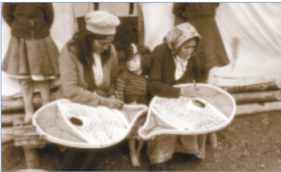
Indiennes de la nation crie fabriquant des raquettes au Grand Lac Mistassini, 1950.

« Article 109 : Lorsque le ministre signale, dans un rapport, qu'un Indien a demandé l'émancipation et qu'à son avis, ce dernier a) est âgé de vingt et un ans révolus, b) est capable d'assumer les devoirs et les responsabilités de la citoyenneté, et c) pourra, une fois émancipé, subvenir à ses besoins et à ceux des personnes à sa charge, le gouverneur en conseil peut déclarer par ordonnance que l'Indien, son épouse et ses enfants mineurs célibataires sont émancipés. »