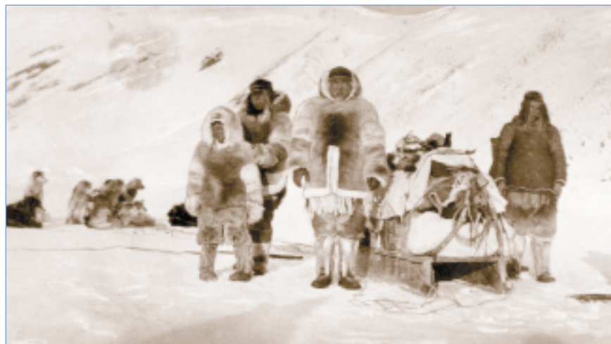
Inuits partant pour la chasse du printemps, photographiés en 1911 lors d'une expédition du capitaine Bernier.