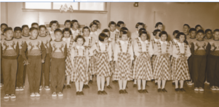
Élèves du pensionnat amérindien de Saint-Marc-de-Figuery, près d'Amos, dans les années 1950.