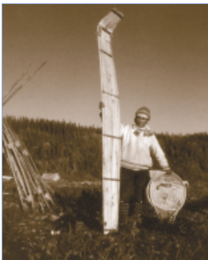
Naskapi avec son grand toboggan de 3 mètres de longueur, Fort Mackenzie, 1941.

droit fondamental sur le plan des droits de la personne, le droit de maintenir et de faire progresser