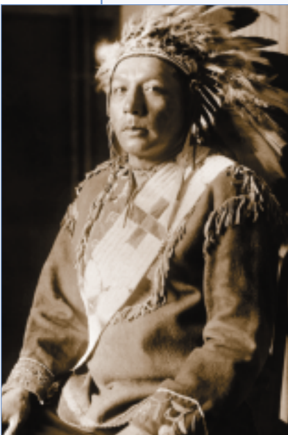
Le chef cayuga Deskaheh de la réserve des Six Nations en Ontario, photographié à l'occasion de son séjour à Genève en 1923-24.