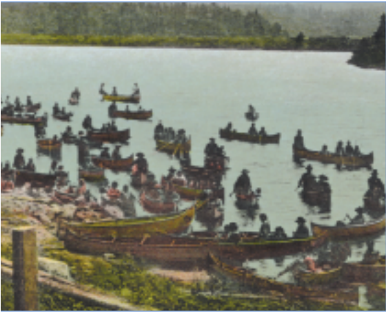
Une quarantaine de canots rassemblés au Grand lac Victoria, vers 1930.