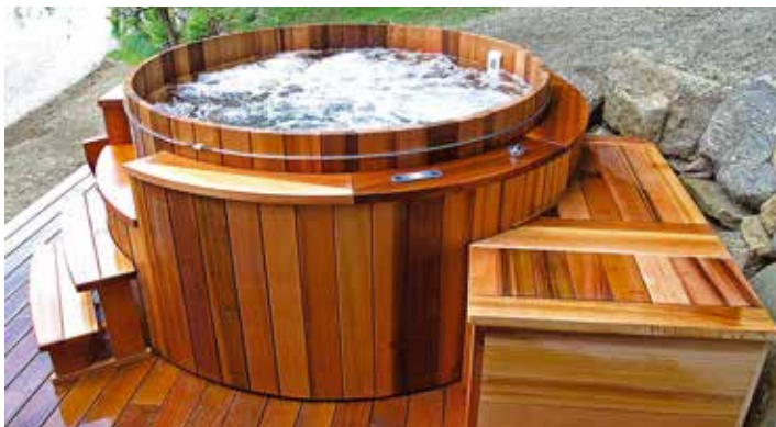
SPA en cèdre rouge de l'ouest

Les deux principales raisons qui incitent un client à opter pour un produit du bois est sa beauté (Finition) et sa durabilité. Le prix est un facteur secondaire pour le client qui cherche le vrai, le beau et le durable. On ne doit pas viser la clientèle qui achète un prix. Tant qu'un client potentiel aura la perception que les produits du bois demandent un entretien fréquent et difficile, et que le produit se dégrade au soleil ou est non durable, il n'y a aucune raison d'espérer une augmentation de la demande.